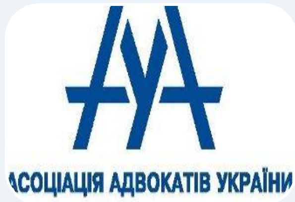
Асоціація адвокатів України