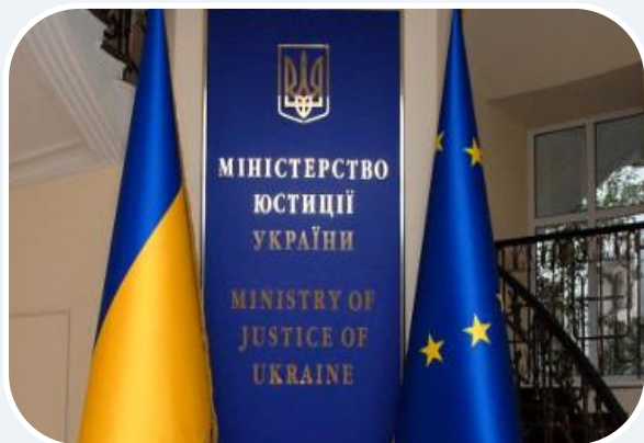
Міністерство юстиції України