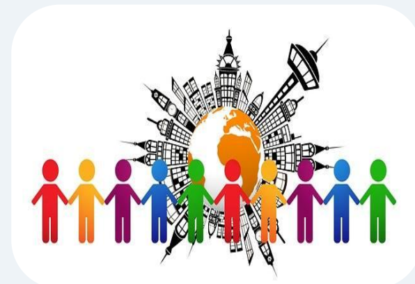
Інститут захисту інформаційних прав громадян